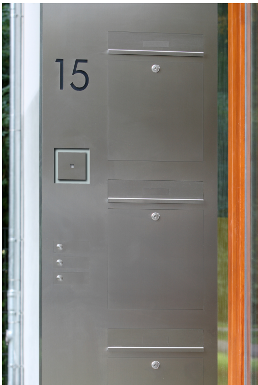
▲ 47/1 Briefkastenstele Inoplan mit Großraum- briefkästen und integrierter Türstation

Ob Zugangskommunikation, Versorgung mit Medien oder auch als Briefkastenstele mit Postgutaufnahme: Diese multifunktionalen Zentren der Linie Inoplan erfüllen (fast) jeden Anspruch. Gerne planen wir Ihre individuelle Multifunktionsstele.